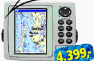
IntelliMap 500C Maksimal farveplotter - til en billig pris! Vejl. pris kr. 5.999,-

Fender Majoni Star 2. 15 x 58 cm. Farve: Blå eller hvid. Str.: 6"