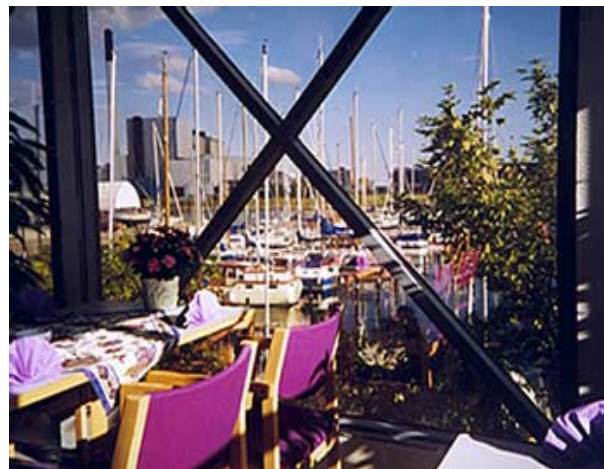
Udsigt - til havn og små priser