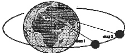
månens position to efterfølgende dage. Afstanden svarer til en tidsforskel på 50 min.