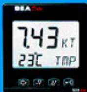
Silva Star Sea Data Inkl. logtekmode transducer Vejl. pris 2.999,-