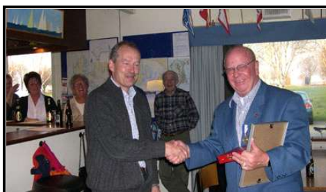
Fra generalforsamlingen - udnævnelsen af KTF første æresmedlem

Jeg vil afslutte denne beretning, hvis sidste del stiller flere spørgsmål end den giver svar, med håbet om, at vi i aften kan få en debat om fremtidsvisionerne for foreningens arrangementer og situationen vedr. vores klubhus.