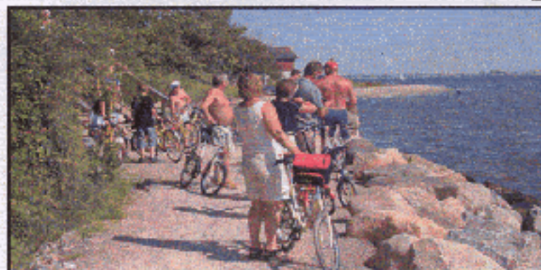
Fra KTF's "Tour de Ven"