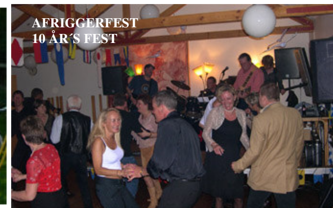
AFRIGGERFEST 10 ÅR'S FEST