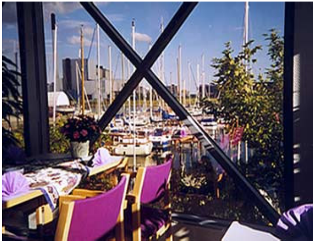
Udsigt—til havn og små priser

Husk hver Søndag har vi stor buffet til kun Kr. 95,- Bordbestilling er en god ide