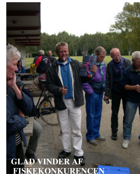
GLAD VINDER AF FISKEKONKURENCEN